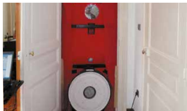
Le test d'étanchéité à l'air (ou test de la « porte soufflante ») sert à mesurer les entrées et sorties d'air parasites.

Il est obligatoire . On l'effectue en bouchant les entrées et sorties d'air du système de ventilation et en mettant le bâtiment en surpression ou en dépression. Il est ainsi possible d' estimer les entrées et sorties d'air parasites . Pour que le bâtiment soit conforme à la réglementation, le débit de fuite d'air vers l'extérieur doit être inférieur à 0,6 m 3 par m 2 de paroi et par heure sous une pression de 4 Pa.