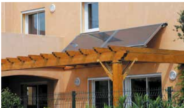
Une pergola est un exemple d'élément architectural qui contribue à protéger votre logement en cas de fortes chaleurs.

* À conforter grâce au choix de matériaux et d'équipements (revêtements, peintures, mobilier...) émettant peu de polluants volatils.