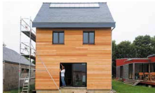
Le CCMI sans fourniture de plan peut comporter des « lots réservés » que vous vous chargez de réaliser.

Dans le CCMI sans fourniture de plan , vous fournissez le plan (élaboré par vous, un architecte ou un autre professionnel, mais sans aucun lien avec le constructeur), les travaux sont assurés par une seule entreprise, avec qui vous passez ce CCMI, ou par plusieurs. Dans ce cas, le constructeur se charge au minimum des travaux de gros oeuvre, de mise hors d'eau (charpente et couverture) et de mise hors d'air (menuiseries extérieures). Les travaux restants sont assurés par des entreprises avec lesquelles vous passez des contrats d'entreprise lot par lot (voir ci-après).